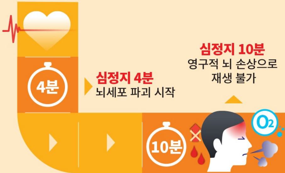
심폐소생술에 의한 시간대별 생존율